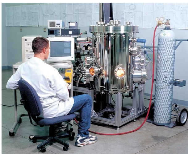
Obr. 1: Procesní vakuová komora v Sandia National Laboratories v USA

Společnost Nor-Cal Products, Inc. je významným světovým výrobcem a dodavatelem vakuové techniky pro průmyslové aplikace, vědu a výzkum. Svým zákazníkům již více než 50 let dodává mimořádně kvalitní vakuové příruby, šroubení, ventily, procesní komory a další komponenty pro vakuové systémy. V přímé spolupráci s výrobcí zařízení pro polovodičový průmysl obohatily nově klasické portfolio výrobků systémy pro regulaci vakua včetně izolačních a regulačních ventilů. Výrobky společnosti Nor-Cal těží z dlouhodobé podpory vědeckého výzkumu, zásluhou čehož jsou trvalým etalonem vakua. Například spolupráce s výzkumným ústavem Lawrence Livermore National Laboratory, známým zejména pro výzkum v oblasti jaderné energetiky, dala vzniknout mnoha standardům pro vakuová šroubení.